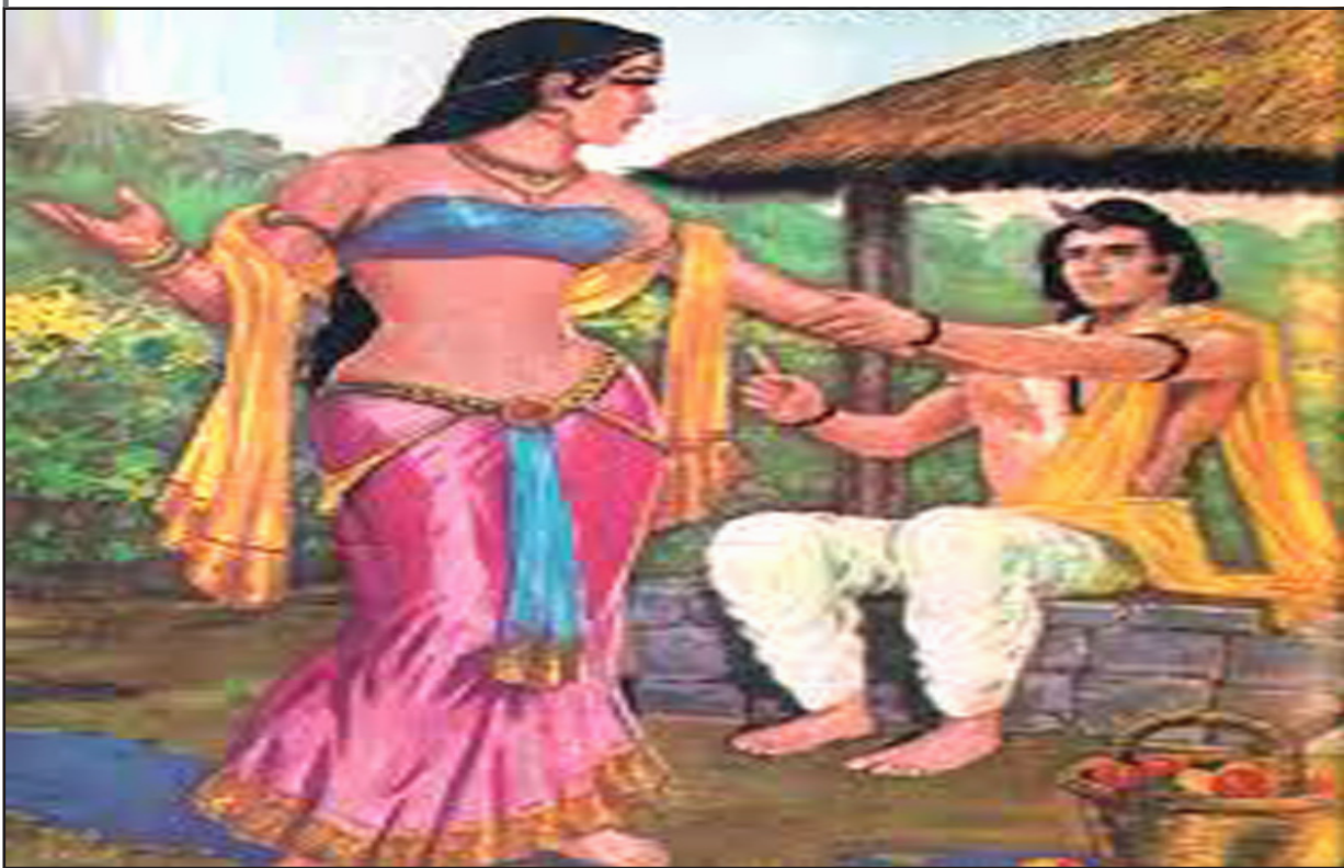
ପୌରାଣିକ କଥାବସ୍ତୁ ଅନୁସାରେ ରାମାୟଣ, ରାମଚରିତ ମାନସ, ଆଧାର ରାମାୟଣ ଏବଂ ଆନନ୍ଦ ରାମାୟଣ ସଂପର୍କରେ ବିଭିନ୍ନ ସମୟରେ ଶୁଣାକୁମ୍ଭାଙ୍ଗେ ଚର୍ଚ୍ଚା କରିଆଣ୍ଡି । ଏହିସବୁ ରାମାୟଣକୁ ଅଧ୍ୟୟନ କଲେ ପ୍ରଭୁ ଶ୍ରୀରାମଙ୍କ ସହ ଜଡ଼ିତ ଅନେକ ତଥ୍ୟର ସୂଚନା ମିଳେ । ଦକ୍ଷିଣ ଭାରତର ରାମାୟଣ ଗ୍ରନ୍ଥ ଅନୁସାରେ ପ୍ରଭୁ