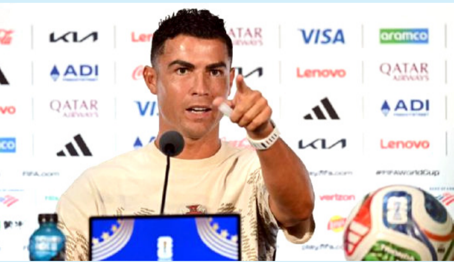
କରି ଦଳକୁ ପ୍ରି-କ୍ୱାର୍ଟର ପାଇନାଲ ଟିକେଟ ଦେଇଛନ୍ତି। ପର୍ଯ୍ୟାୟର ମୁକାବିଲା ରାଉଣ୍ଡ ଅଫ ୧୬ରେ ହେବ ଏବଂ ଏହାପୂର୍ବରୁ ଆୟୋଜିତ ସାମାଜିକ ସମ୍ମିଳନୀରେ ରୋନାଲଡୋ କହିଛନ୍ତି ଯେ 'ମୁଁ ଏହି ବିଶ୍ୱକପକୁ ଯଥା ସମ୍ଭବ ଉପଭୋଗ କରିବାକୁ ଚାହୁଁଛି। କାରଣ ଏହା ମୋର ଶେଷ ବିଶ୍ୱକପ। କିନ୍ତୁ ଆଶା କରୁଛି ଆସବାବାଳିର ମ୍ୟାଚ

ଲିସବନ, ୬।୭: ପୁରସ୍କାର ଜିତିହାସର ଅନ୍ୟତମ କିମ୍ବଦନ୍ତୀ ଖେଳାଳି କ୍ରିଷ୍ଟିଆନୋ ରୋନାଲଡୋଙ୍କ ନେଇ ଆସିଛି ବଡ଼ ଖବର। ଚଳିତ ବର୍ଷ ସେ ନିଜ ପୁରସ୍କାର କ୍ୟାରିୟରର ଶେଷ ବିଶ୍ୱକପ ଖେଳୁଛନ୍ତି। ପରବର୍ତ୍ତୀ ବିଶ୍ୱକପରେ ତାଙ୍କୁ ଆଉ ପର୍ଯ୍ୟାୟ ପାଇଁ ଖେଳୁଥିବା ଦେଖିବାକୁ ମିଳିବ ନାହିଁ। ୨୦୨୬ ଟିମ ବିଶ୍ୱକପ ଟାଙ୍କ କ୍ୟାରିୟରର ଶେଷ ବିଶ୍ୱକପ ବୋଲି ନିଜେ ରୋନାଲଡୋ ଆଜି ଘୋଷଣା କରିଛନ୍ତି। ଏବେ ସେ ନିଜ ପୁରସ୍କାର କ୍ୟାରିୟରର ଶେଷ ପର୍ଯ୍ୟାୟରେ ପହଞ୍ଚି ଯାଉଥିବା ମଧ୍ୟ କହିଛନ୍ତି। ୨୦୨୬ ଫିଫା ବିଶ୍ୱକପ ଟାଙ୍କ କ୍ୟାରିୟରର ଶେଷ ବିଶ୍ୱକପ ହୋଇଥିଲେ ହେଁ ସେ ଅବସରକୁ ନେଇ ଏବେ ଠାରୁ କୌଣସି ଆଲୋଚନା କରିବାକୁ ଚାହୁଁନଥିବା ସମସ୍ତଙ୍କୁ ଜଣାଇ ଦେଇଛନ୍ତି। ବିଶ୍ୱକପର ରାଉଣ୍ଡ ଅଫ ୩୨ରେ ପର୍ଯ୍ୟାୟର ମୁକାବିଲା କ୍ରୋଏସିଆ ସହ ହୋଇଥିଲା। ଏହି ମ୍ୟାଚରେ ରୋନାଲଡୋ ପେନାଲ୍ଟି ଗୋଲ କରିଥିବା ବେଳେ ଗୋନକାଲୋ ରାମୋସ ଅତିରିକ୍ତ ସମୟରେ ହେଡରେ ଜରିଆରେ ଷ୍ଟୋର